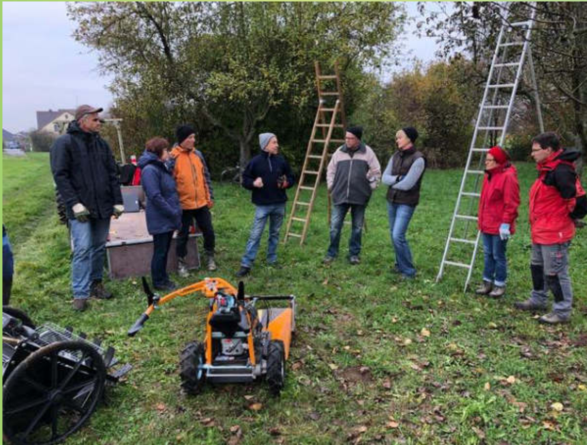
Schnittkurs Bolzwiese 16.11.2019