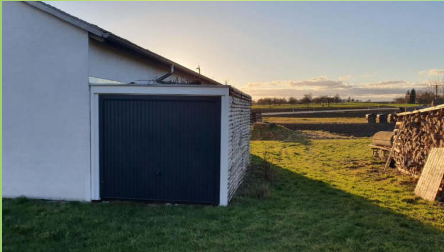
OGV-Garage, Bild vom 20.02.2020