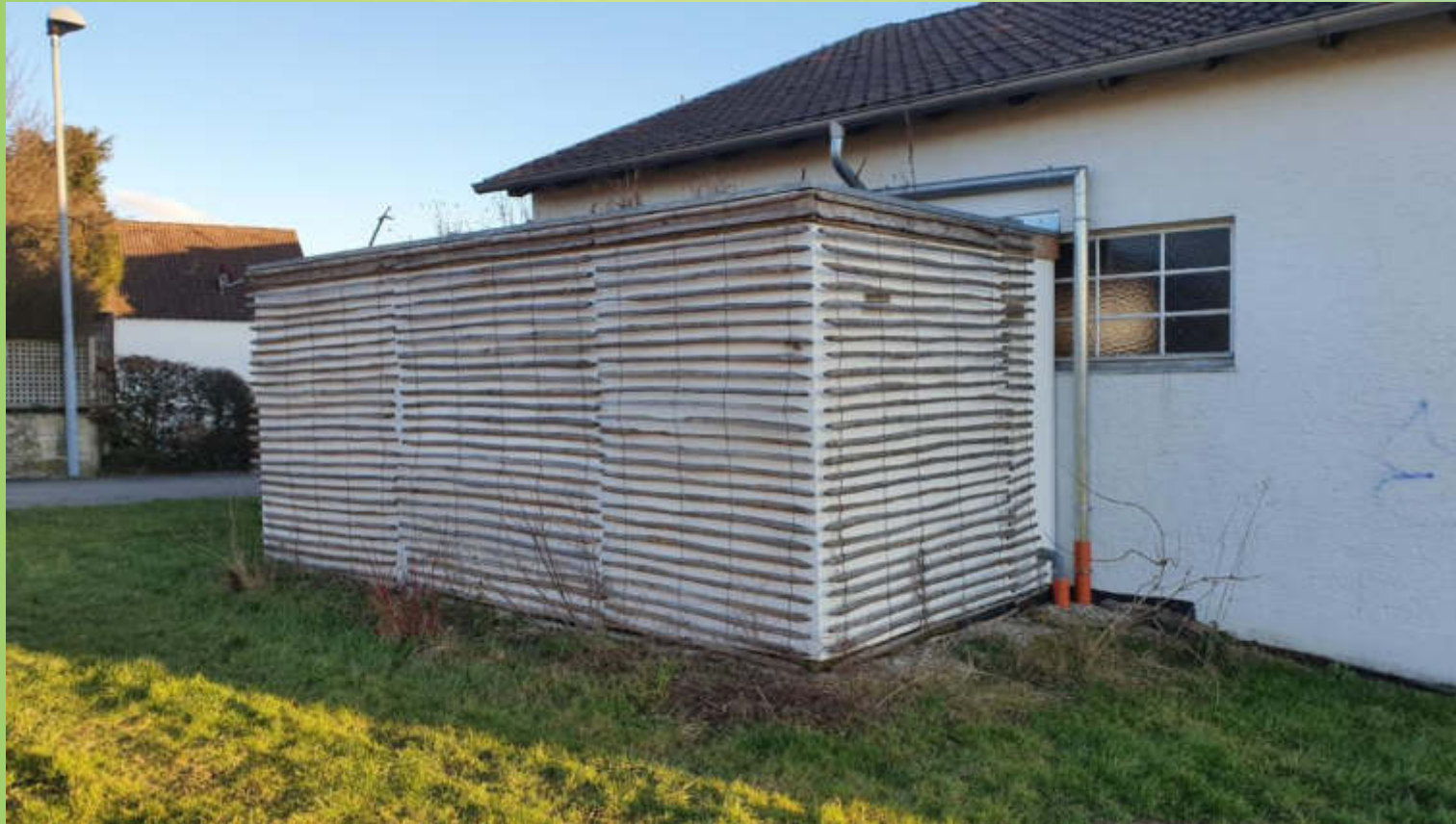
OGV-Garage, Bild vom 20.02.2020