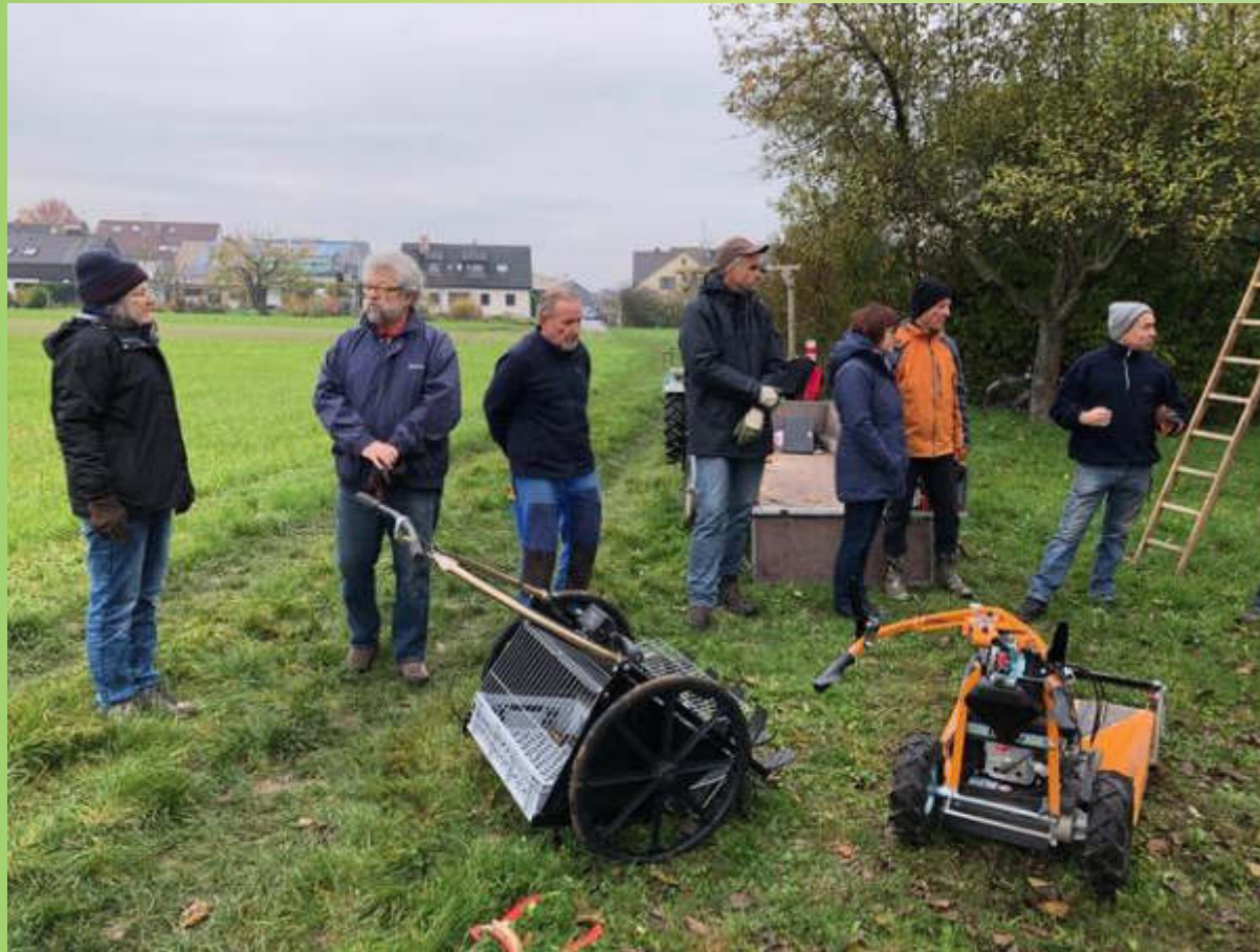
Schnittkurs Bolzwiese 16.11.2019