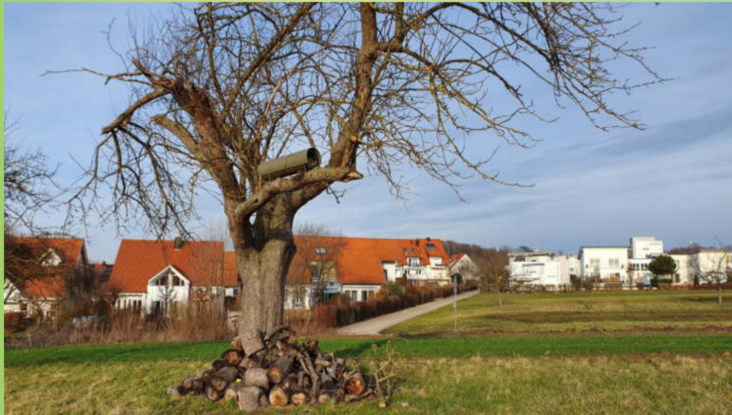
Steinkauz-Nisthöhle, Bild 08.02.2020